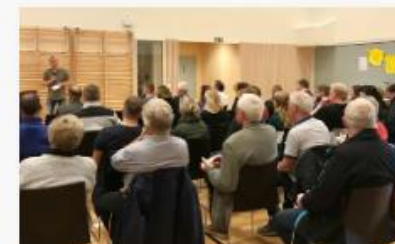
Satsingsområde: Levanger, en samskapende kommune