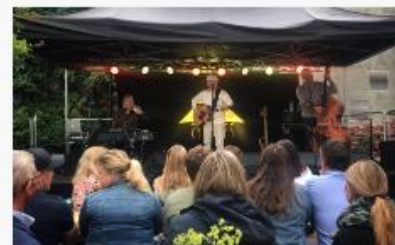
Satsingsområde: Kreative, nytenkende og verdiskapende miljøer