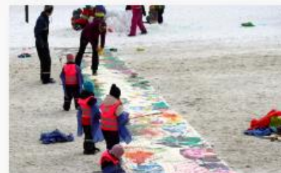
Visjon: Levanger - Triveligst i Trøndelag