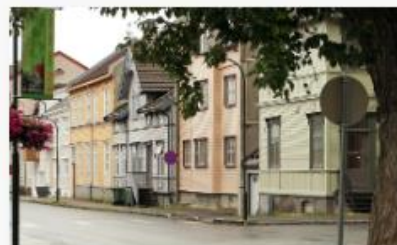
Satsingsområde: Bærekraftige og attraktive lokalsamfunn