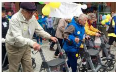
Satsingsområde: Livskvalitet, verdighet og tilhørighet