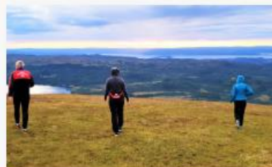
Bærekraftig utvikling i Levanger