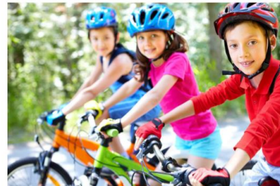
Vedtatt i kommunestyret, sak 1/18 i møte 24.01.2018