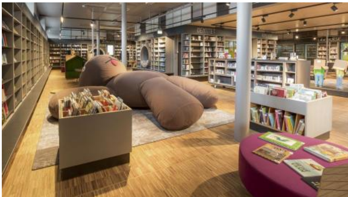
Illustrasjon fra Furuset bibliotek og aktivitetshus