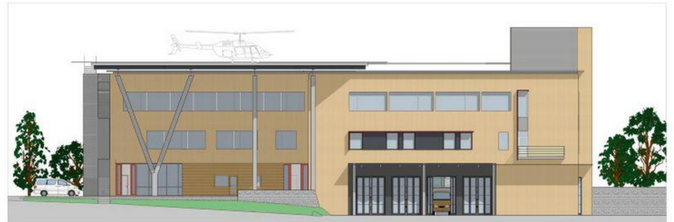
FASADE MOT SØRØST