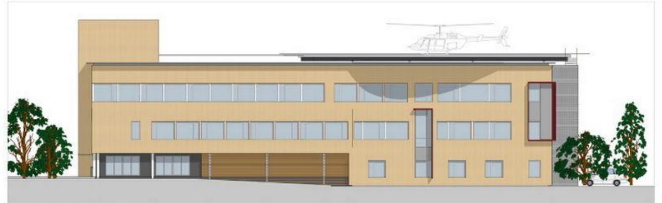
FASADE MOT NORDVEST, Kirkegata